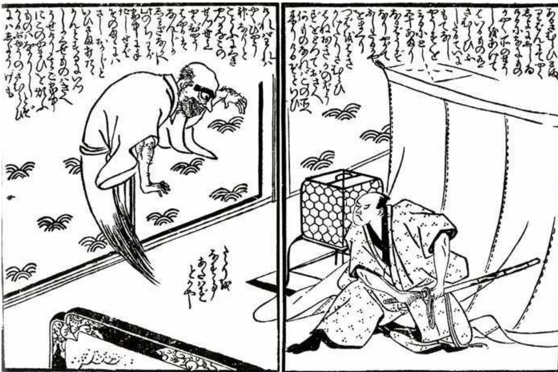
『怪談夜更鐘』（かいだんうしみつのかね）。ある武士のもとに現れたこの疫病神（左）は50歳ほどの坊主の姿だったという。（ウィキペディアより）

「疫神」はウィルスの事です。我々の祖先はウィルスも「目に見えないおそれる存在」ですので「疫病神(やくびょうがみ)」として恐れ鎮めるための祭祀をおこないました。なんと、ウィルスも「神」なんですね。